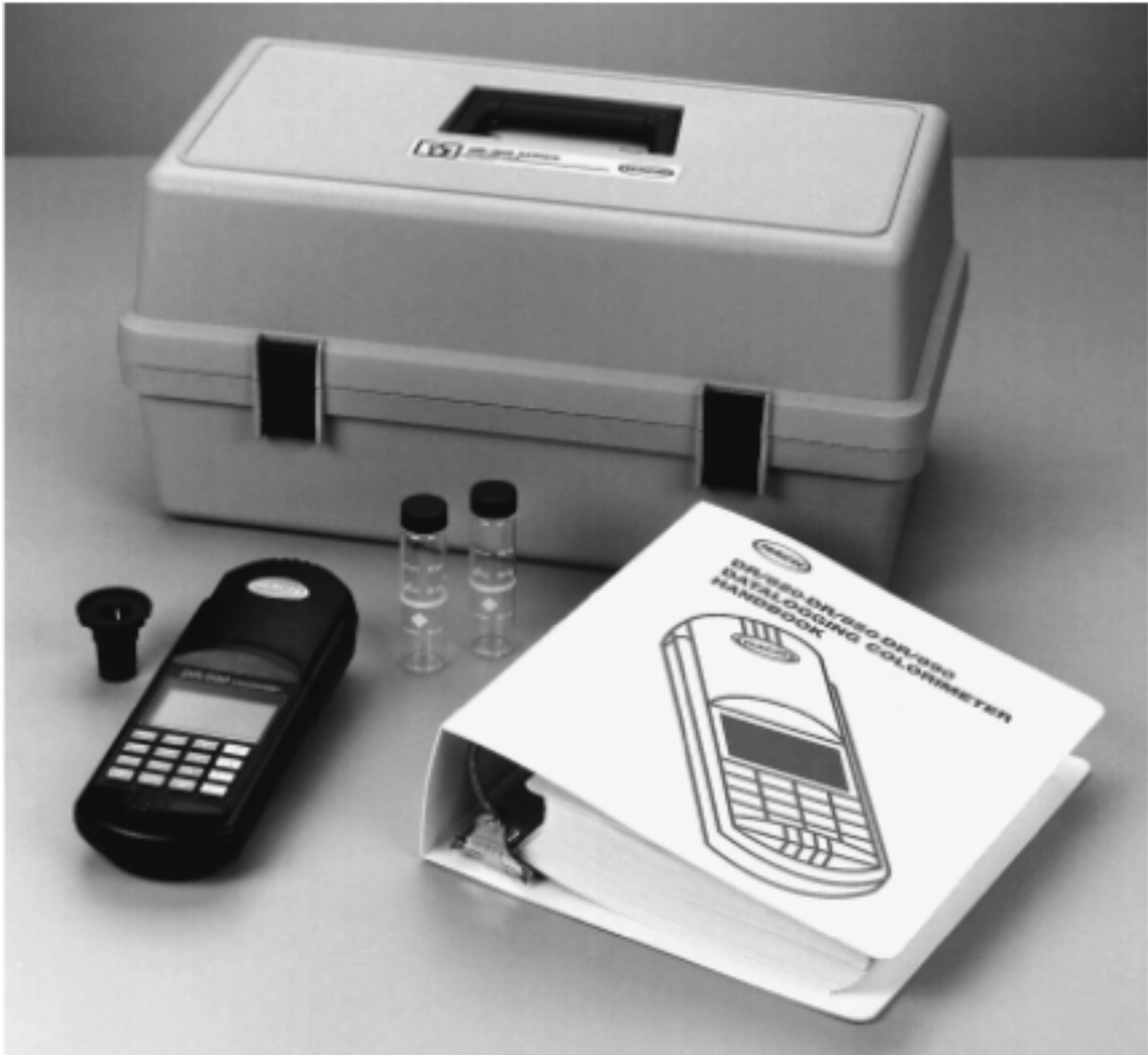
图 1 DR/800 系列色度仪标准包装*